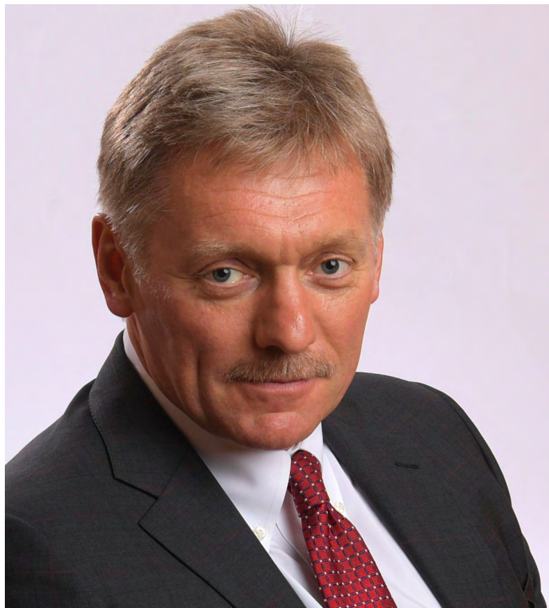
Дмитрий Сергеевич Песков

Пресс-секретарь Президента Российской Федерации, Заместитель Руководителя Администрации Президента